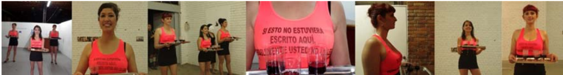
Colectivo Zunga – Colombia – 2012

las islas pacíficas. Así que observamos que según la lengua, hay una distribución de hablantes bastante desigual. En primer lugar, al hablar de la desaparición de lenguas hay que mencionar la explotación. Una preocupación bastante grande en particular es lo que pasa dentro de los bosques amazonas. A pesar de luchar muchos años para proteger la tierra de la gente indígena, todavía siguen ocurriendo invasiones por razones económicas.” La Muerte de las Lenguas Indígenas - Colleen Walsh